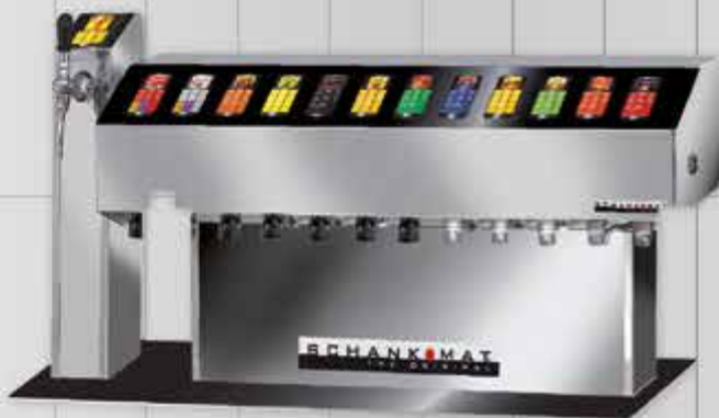
←···· SCHANKOMAT VARIANTE ..... Den individuellen Möglichkeiten sind keine Grenzen gesetzt: Bedienoberfläche: Standard - Tasten, Touchfelder oder kapazitive Tasten. Wir passen das Schankgerät an Ihre Bedürfnisse an. Auch die Gehäuseform sowie die Ausführung lässt keine Wünsche offen.