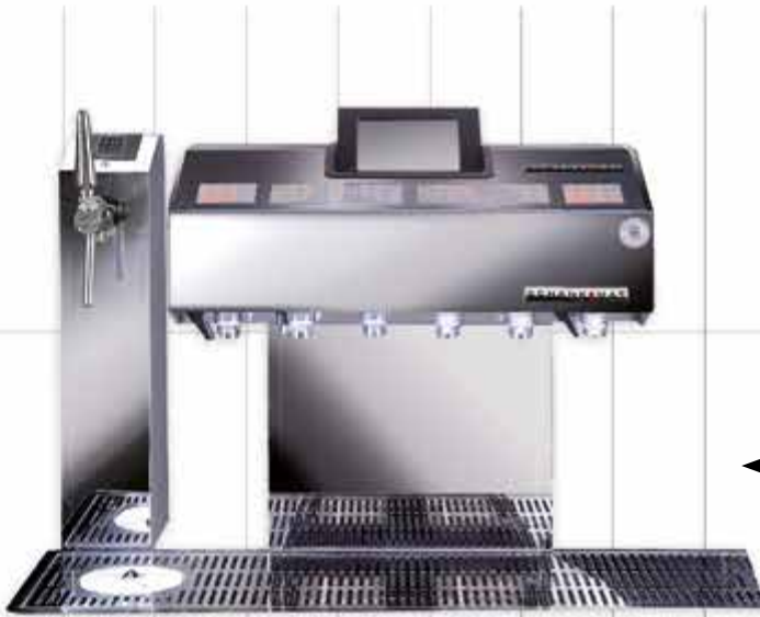
←···· AVANTGARDE COMPUTERSCHANKGERÄTE ..... State of the Art in Design und Technologie.