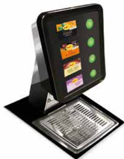
BREAKFAST TOWER 4 oder 6 LEITIG

Die edle Kombination aus Holz, Edelstahl und einem High-Tec Touchbildschirm fügt sich unauffällig in jede Buffetlandschaft und besticht durch Design und Funktionalität. Bis zu 4 gekühlte Frühstücksgetränke, Stillwasser, Sprudelwasser und Heißwasser (selbstverständlich mit Kindersicherung) bereichern Ihr Buffet.