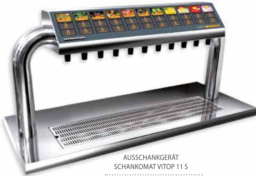
AUSSCHANKGERÄT SCHANKOMAT VITOP 11 S

Die Schankomat-GrapiVit-Zapfsysteme bieten eine Vielzahl an Möglichkeiten, das Ausschanksystem den Kundenwünschen anpassen zu können. Alle Systeme können mit Kassen- und Kartensystemen kombiniert werden.