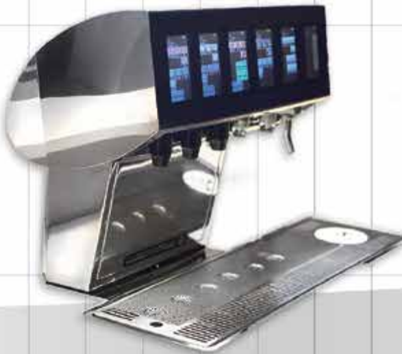
←···· SCHANKOMAT COMPUTERTOUCHGERÄT ..... Design trifft Technologie - bedienerfreundliche Touchfelder ermöglichen einen perfekten Ausschank