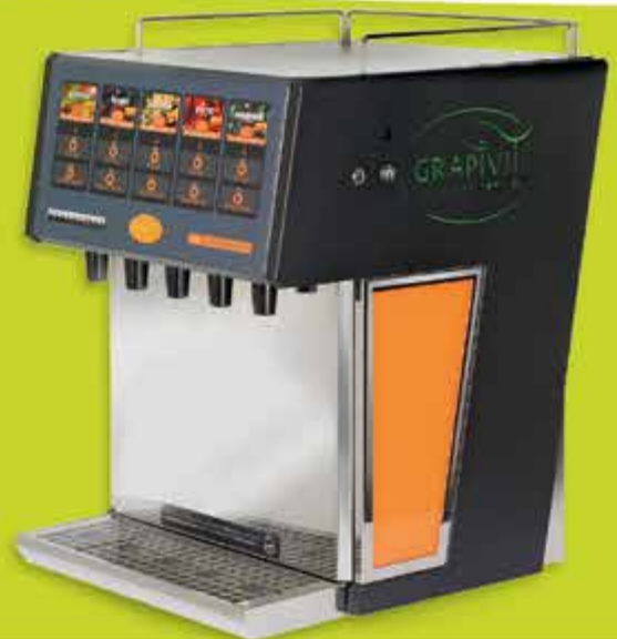
SCHANKOMAT AUSSCHANKGERÄT V5S

Das 7-leitige GrapiVit Oberthekengerät „Schankomat V7“ bietet die Möglichkeit, die GrapiVit-Produkte sowohl „STILL“ als auch „SPRITZIG“ zuzubereiten.